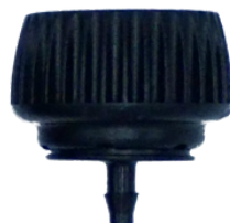
Spojka 3/4" x 4mm