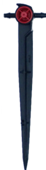
Kapkovač Spike průběžný