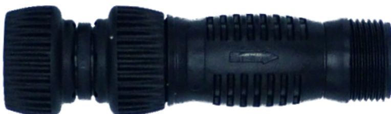
Filtr 150 Mesh